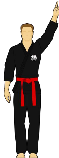
Schéma 8a : « Combattant rouge touche la cible 1, 1 point »