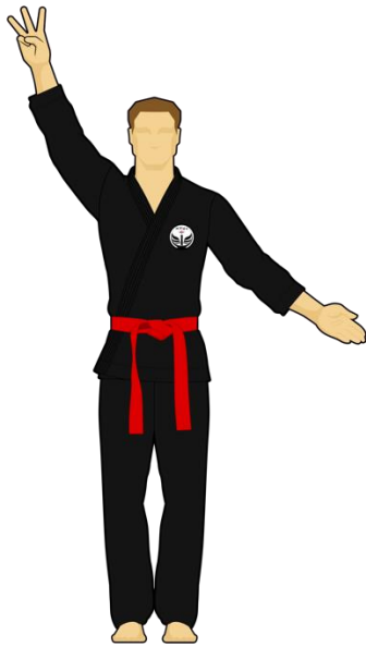
Schéma 11 : « Sortie de l'arène » Le combattant rouge est sorti de l'arène de combat en mettant les deux pieds dehors de façon intentionnelle. Les points reviennent au Combattant vert.