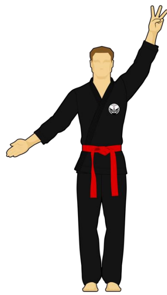
Schéma 12 : « Sortie de l'arène » Le combattant vert est sorti de l'arène de combat en mettant les deux pieds dehors de façon intentionnelle. Les points reviennent au Combattant rouge.