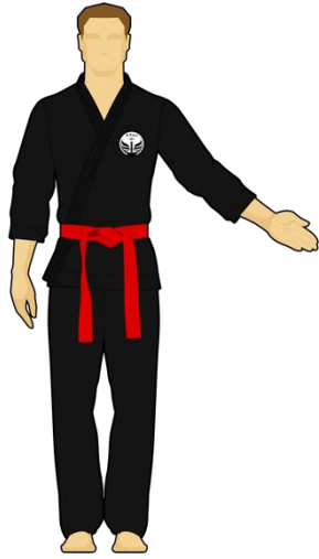
Schéma 9 : « Sortie de l'arène non intentionnelle » Le combattant rouge est sorti de l'arène de combat en mettant les deux pieds dehors de façon non intentionnelle (bousculade).