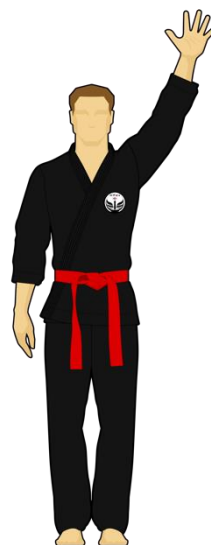
Schéma 8c : « Combattant rouge touche la cible 3, 5 points »