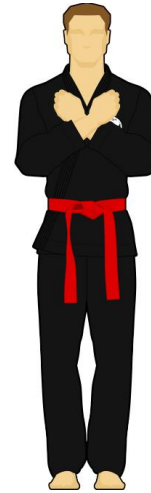
Schéma 4 : « Abstention », indécision de l'arbitre. Il n'a pas vu la faute ou la touche