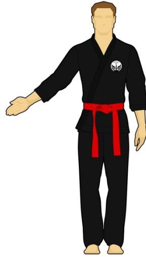
Schéma 10 : « Sortie de l'arène non intentionnelle » Le combattant vert est sorti de l'arène de combat en mettant les deux pieds dehors de façon non intentionnelle (bousculade).